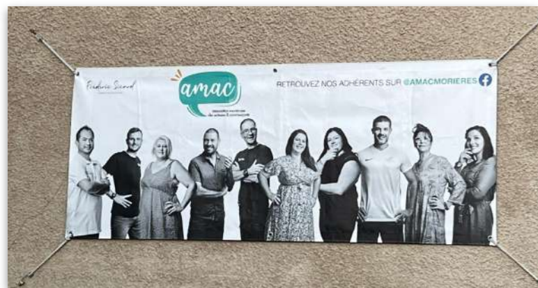
4 grandes bâches tournent dans la ville de Morières